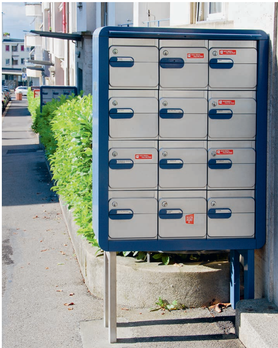
Les régies autorisent l'étiquette «pas de publicité» sur les boîtes aux lettres (ici celle de la Fédération romande des consommateurs, FRC). La Bâloise Gestion immobilière a édité son propre modèle d'étiquette, à disposition des locataires auprès des concierges qui contrôlent leur usage. L'objectif principal est esthétique, mais l'action vise également à sensibiliser les locataires au tri et à éviter le gaspillage.