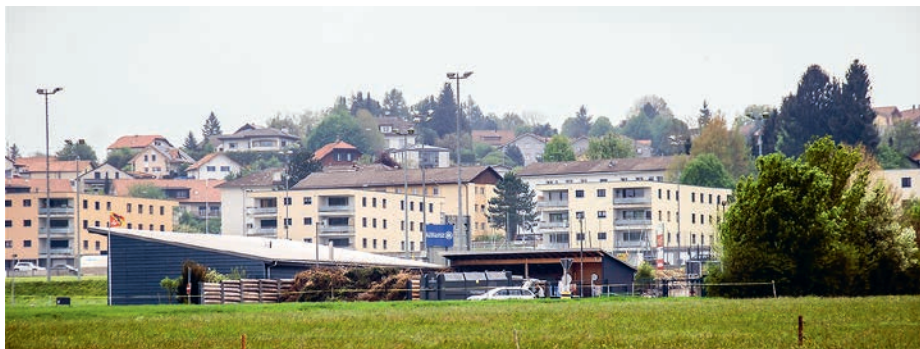
La déchèterie du secteur Farvagny est située à quelques minutes à pied du centre du village, mais rares sont les usagers non motorisés sur la commune de Gibloux.

Les économies réalisées par la diminution des quantités incinérées ainsi que par l'abandon des tournées hebdomadaires de ramassage ont permis de financer l'instal-